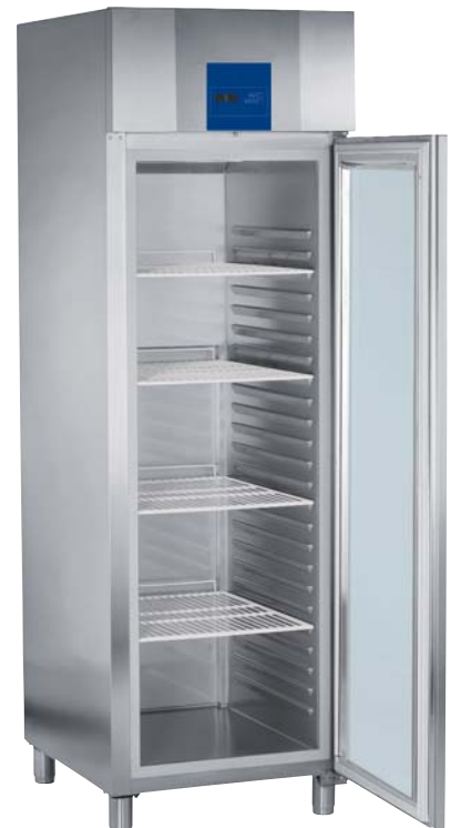
Modelo Stocklow GS, con puerta de vidrio.