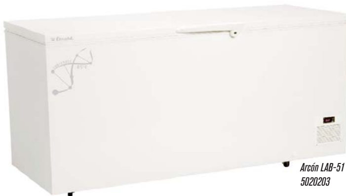
Arcón LAB-51 5020203