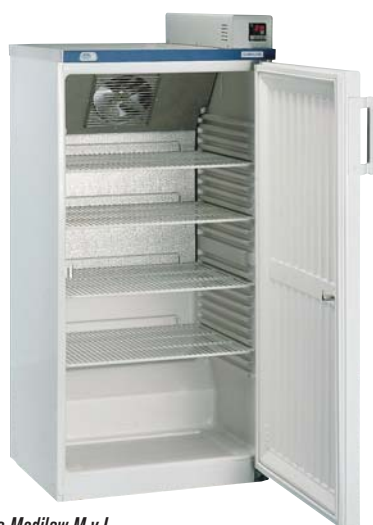
Modelo Medilow M y L.

NORMA EN 61010.1. LIMITADOR TÉRMICO DE SOBRETENPERATURA INCORPORADO.