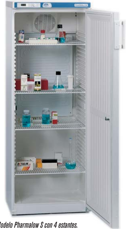
Modelo Pharmalow S con 4 estantes.

Termostato regulador de la temperatura. Termómetro digital lector de la temperatura para los modelos S y L, Regulador electrónico digital de la temperatura para el modelo M.