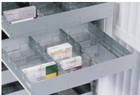
Detalle de los cajones con separadores acoplados al bastidor.