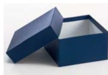
Cajas de cartón según medidas 50, 75 y 100 mm. alto.