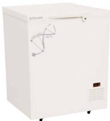
Arcón LAB-11 Código 5020202

PARA TEMPERATURAS REGULABLES DESDE -60 °C. A -85 °C. ESTABILIDAD ±0,5 °C.