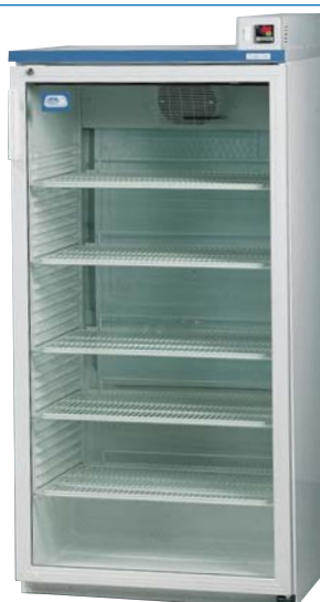
Modelo Medilow LG, con puerta de doble vidrio.

Medilow M: Capacidad: 3 bloques DBO (ver pág. 317)