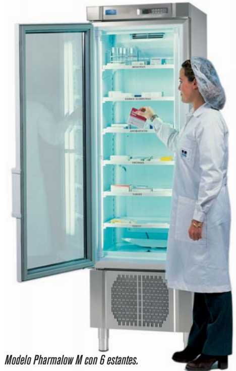
Modelo Pharmalow M con 6 estantes.