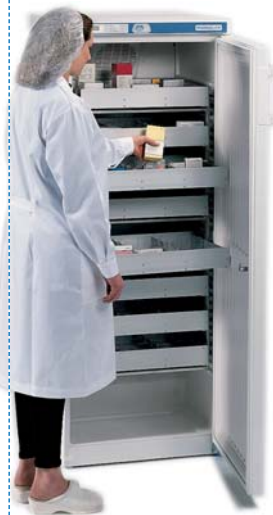
Modelo Pharmalow S y L con bastidor y cajones.