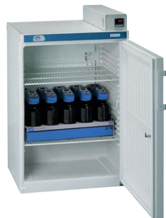
Modelo Medilow S. Capacidad: 2 bloques DBO (ver pág. 317).