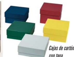
Cajas de cartón con tapa.