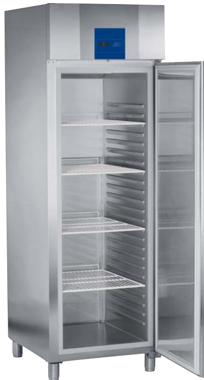
Modelo Stocklow LS, con puerta metálica.

Interruptor general de puesta en marcha. Regulador electrónico de la temperatura. Termómetro digital lector de la temperatura. Interruptor luz interior (solo modelo con puerta de vidrio).