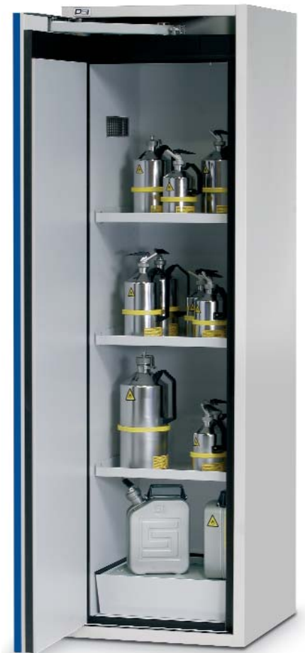
Serie F-2000 código 5028260.