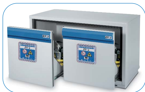
ARMARIOS DE SEGURIDAD RESISTENTES AL FUEGO