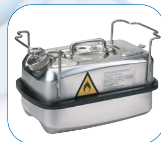
CONTENEDORES DE SEGURIDAD