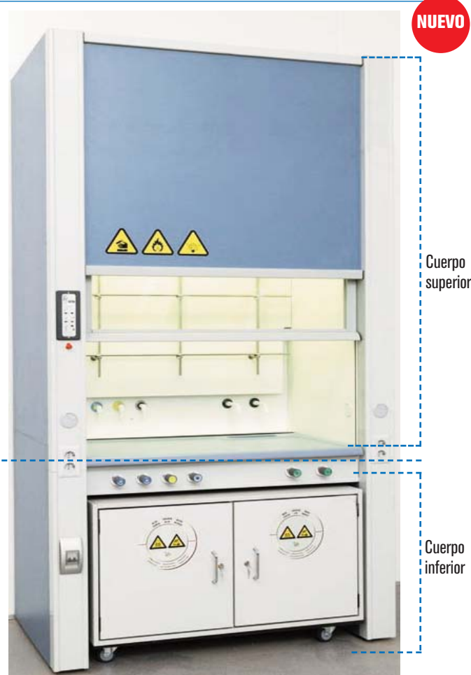
Bajo demanda se puede suministrar con medidas personalizadas.

Pasador de bloqueo de seguridad en puerta para la posición de trabajo recomendada.