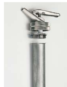
Dispensador con válvula y muelle de descompresión.