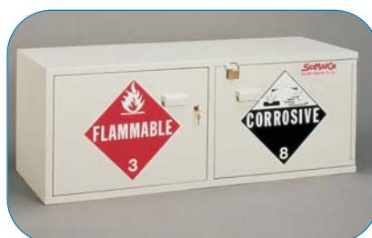
ARMARIOS DE SEGURIDAD ÁCIDOS/INFLAMABLES