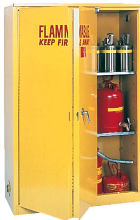
Código 5028171 una puerta corredera de autocierre.