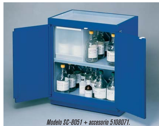
Modelo SC-8051 + accesorio 5108071.

El modelo PS-5030 , contruido con zócalo inferior para ubicación directa al suelo, es ideal para el almacenamiento centralizado.