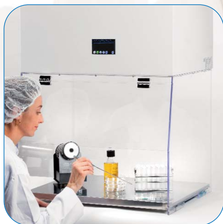
CABINAS DE FLUJO LAMINAR