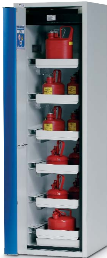
Serie Ergo-Line código 5028276.

Detalle de los cajones retráctiles. Máxima comodidad durante la ubicación o recogida de los envases en el armario.