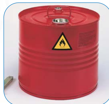
BIDONES DE SEGURIDAD