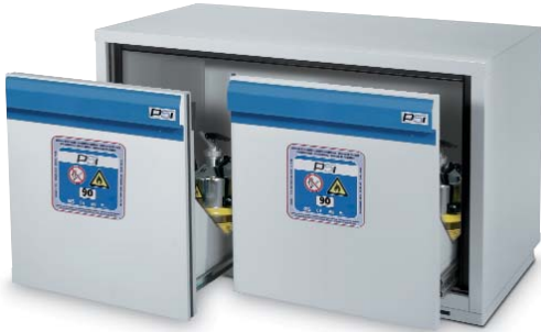
Serie F-2000 código 5028228.