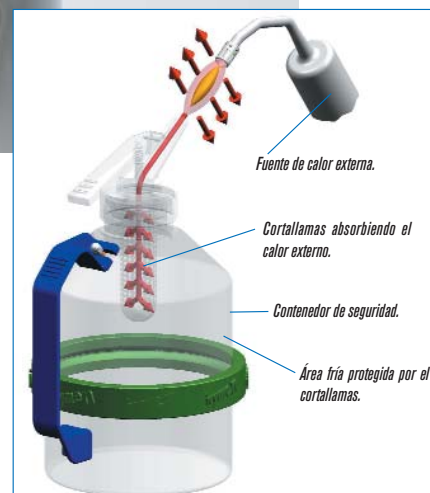
Fuente de calor externa.