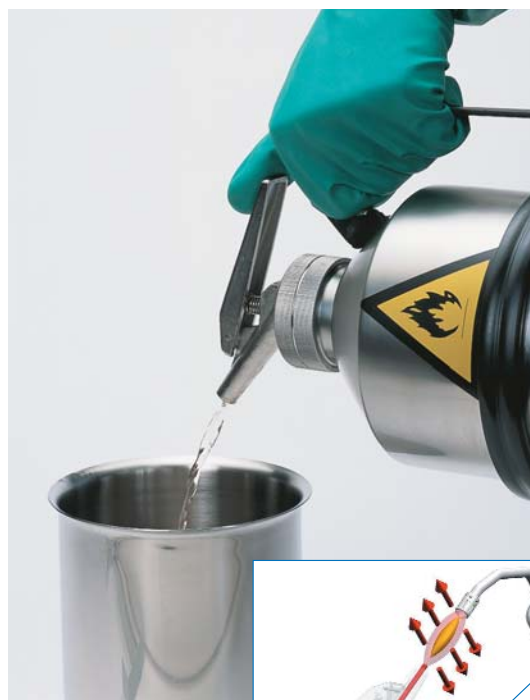
Dispensador de precisión con autocierre que facilita una dosificación exacta.

- Los modelos con dispensador, están dotados además de una válvula on/off de teflón, que proporciona un control instantáneo en la dispensación.