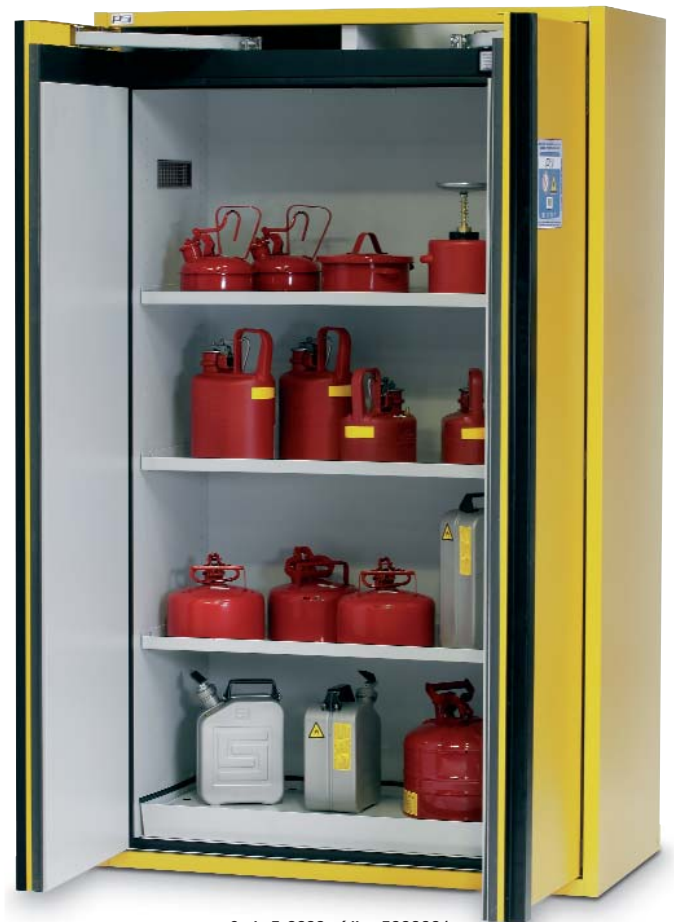
Serie F-2000 código 5028221.