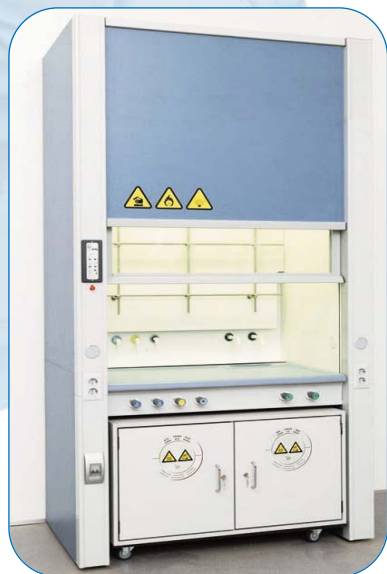
VITRINAS DE GASES