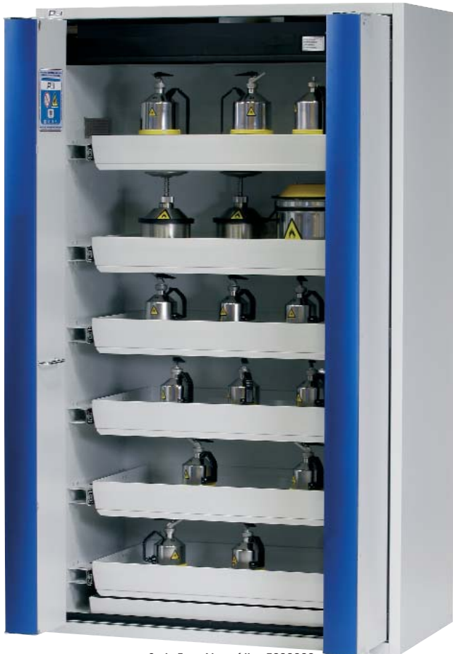
Serie Ergo-Line código 5028286.