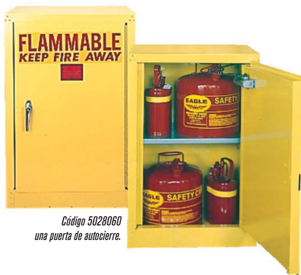
Código 5028060 una puerta de autocierre.