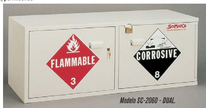
Modelo SC-2060 - DUAL.