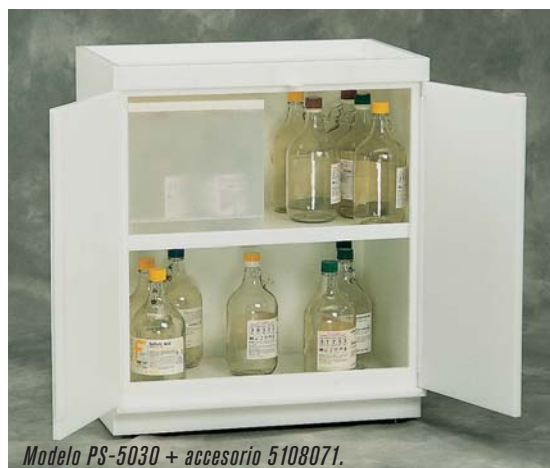
Modelo PS-5030 + accesorio 5108071.