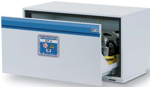
Serie F-2000 código 5028227.