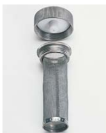
Tapón con válvula y muelle de descompresión con dispositivo de sujeción al recipiente.