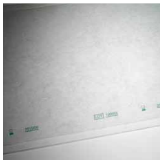
Traçabilité au sachet avec filtre / Traceability on each filter bag