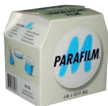
Lámina de cierre a base de poliolefinas y ceras de parafina. Temperatura de trabajo -45 °C a +50 °C (punto de fusión +60 °C). Resiste las soluciones salinas, ácidos y bases inorgánicas más comunes en el laboratorio y algunos disolventes orgánicos (metanol, etanol e isopropanol). No resiste, sin embargo, dietiléter, cloroformo, tetracloruro de carbono, benceno o tolueno